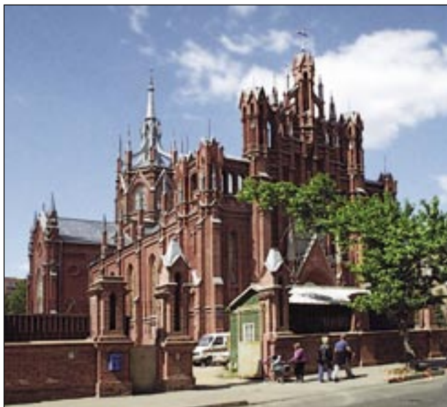
Кафедральный собор - Костёл непорочного зачатия Пресвятой Девы Марии (Москва)

Религиозная вера и вера в Путина хорошо уживаются в сознании людей. Ещё в августе