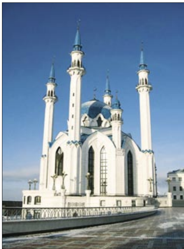
Главный мусульманский храм – мечеть Кул-Шариф (Казань)

Ещё один показатель православной религиозности – соблюдение постов. По данным ФОМ 2002 г., 6% соблюдают Великий Пост, 3% – “Великий Пост и некоторые другие главные посты”, 2% – “все главные посты”, 1% – “главные посты, среду и пятницу”. 88% постов не соблюдают [5]. Этот же опрос показал, что лишь 4% регулярно читают Евангелие и более или менее регулярно другие положенные тексты, и ещё 11% ответили,