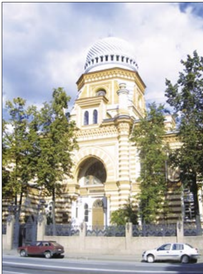
Большая хоральная синагога (Санкт-Петербург)

Во-первых, больше половины населения – 53% в большей или меньшей степени верят в существование Бога: 32% говорят в опросе: “я знаю, что Бог существует, и не испытываю в