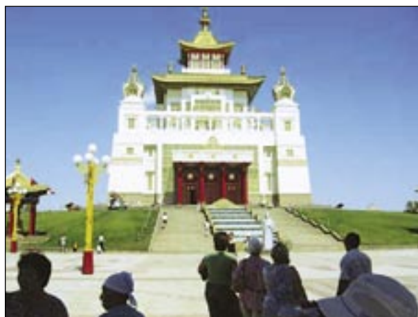
Буддийский храм (г. Элиста, Калмыкия)

Вдвое меньшее число людей выделяют ещё две причины популярности веры. 10% считают, что “люди тянутся к религии, потому что сейчас это модно”, и 9% объясняют это тем, что за религией “стоит вера во что-то сверхъестественное, в Божественный промысел”. Наконец, 10% не видят, “чтобы люди сегодня особо тянулись к религии”, и лишь 3% считают, что тяга