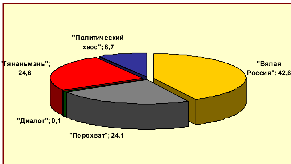
Рисунок 2. Шансы сценариев на конец февраля 2012 г.

Главное ясно фиксируемое отличие состоит в резком росте (в четыре раза) шансов сценария «Тянаньмэнь» при некотором сокращении шансов сценариев «Перехват» и «Вялая Россия».