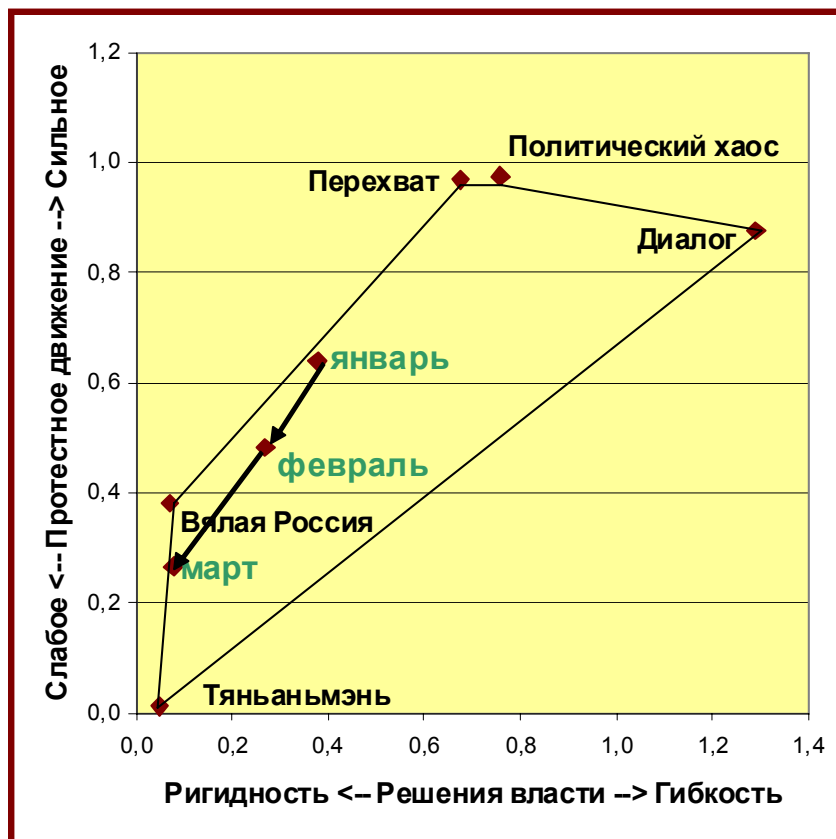
Рисунок 2. Диаграмма взаимного расположения сценариев в политическом пространстве сегодняшней России. Точки, помеченные надписями «январь», «февраль» и март, характеризуют политическое положение в стране на соответствующие моменты времени по результатам прогнозирования

плоскости, оси которого имеют ясный политический смысл, установленный в исследовании, изложенном в упомянутом докладе. Каждый результат прогноза представляется точкой внутри пятиугольника. На диаграмме Рисунок 2 виден сдвиг политической ситуации с конца января по середину марта.